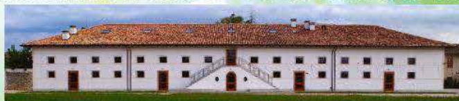
FOLADOR di Villa Rubini - Località Merlana - Via Santa Maria, 20 - 33050 Trivignano Udinese (UD)

TRIVIGNANO UDINESE - FOLADOR di Villa Rubini